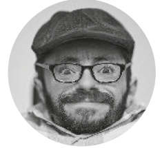
Raul Krauthausen, 43, Aktivist für Inklusion und Barrierefreiheit

„Ich sitze im Rollstuhl. Und ich habe dafür gesorgt, dass er zu meinem Lieblingsgadget geworden ist. Ich habe zum Beispiel an meinem Rollstuhl-Akku einen USB-Anschluss installieren lassen, über den ich mein Smartphone aufladen kann. Außerdem habe ich einen aufklappbaren Tisch anbauen lassen, wie im Flugzeug. So kann ich überall essen oder arbeiten. Und ich habe in meinem Stuhl ein modulares Koffersystem integriert, das ich variabel einrichten kann, je nachdem, wie viel Gepäck ich bei einer Reise transportiere. Was ich gerne noch hätte, wäre ein Ladegerät für meinen Laptop. Das ist nicht ganz so trivial, weil das eine andere Stromspannung benötigt. Rollstühle werden oft von Menschen ohne Behinderung gebaut, deswegen werden viele Dinge leider nicht mitgedacht. Es wäre schön, wenn sich das ändert, damit Menschen mit Behinderung Selbstverständlichkeiten nicht einfordern müssen.“